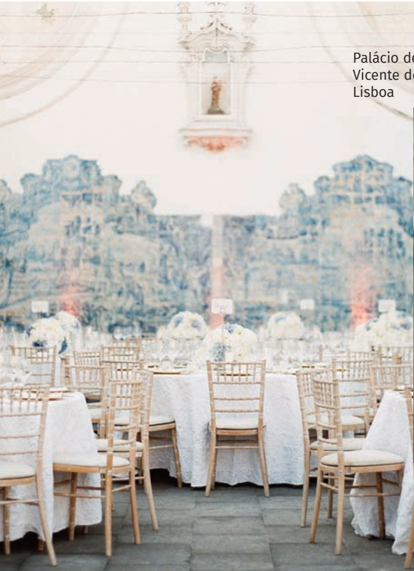
Palácio de São Vicente de Fora, Lisboa