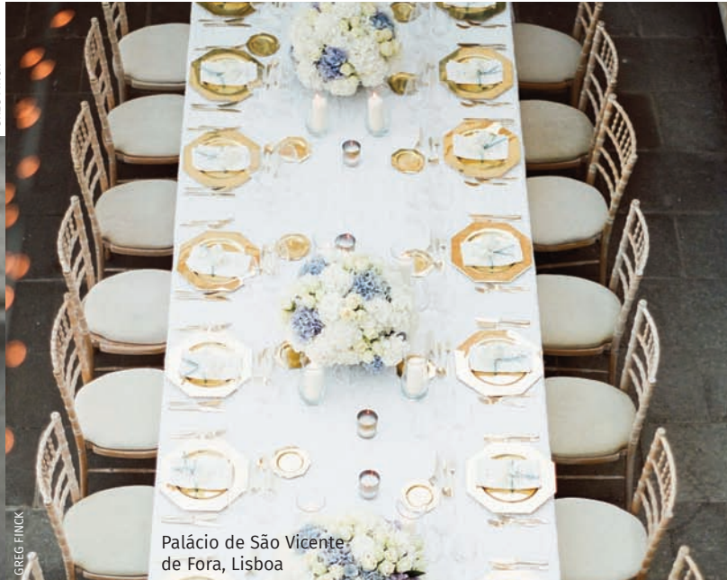
Palácio de São Vicente de Fora, Lisboa