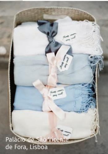
Palácio de São Vicente de Fora, Lisboa