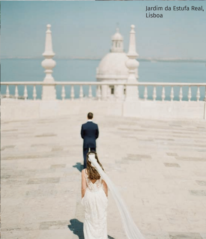
Jardim da Estufa Real, Lisboa