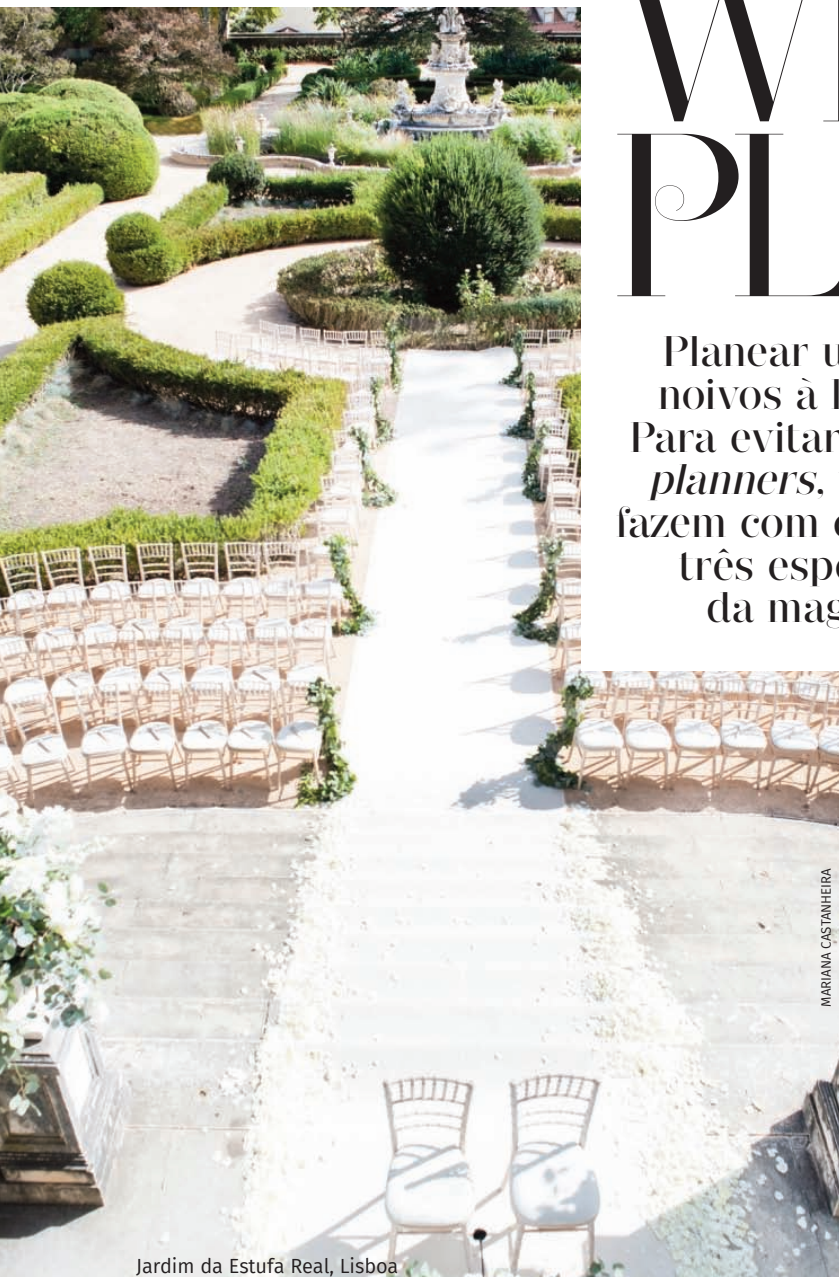
Jardim da Estufa Real, Lisboa

Planear um casamento perfeito pode levar os noivos à loucura (e quem os rodeia também!). Para evitar que tal aconteça, existem os wedding planners , uma espécie de fadas madrinhas que fazem com que os sonhos se realizem. Desafiamos três especialistas a desvendarem um pouco da magia do seu trabalho. POR CAROLINA CARVALHO