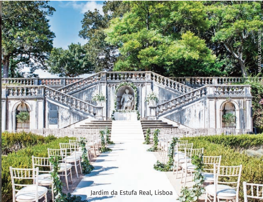
Jardim da Estufa Real, Lisboa